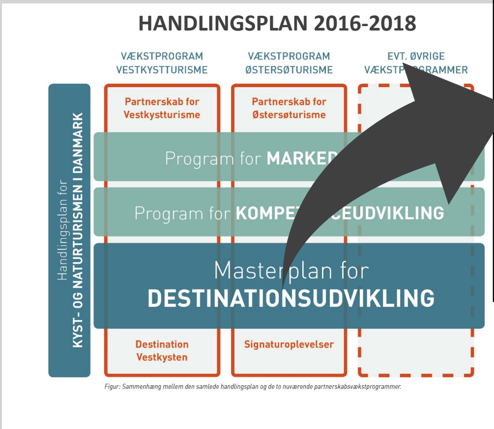
Figur: Sammenhæng mellem den samlede handlingsplan og de to nuværende partnerskabsvækstprogrammer.